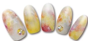
タイダイアレンジアート