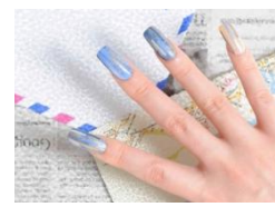
ジェルパーツアート