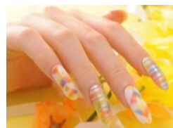
エアブラシ風アート