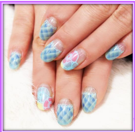
デモンストレーション作品

カルジェルID保持者を対象とした、カルジェルデモンストレーションと自由練習。デモンストレーションでは、モデルに2パターン5本ずつ計10本のサロンワークを行います。デモを行いながら、技術の上達ポイントからサロンワークのQ&Aなどを幅広くレクチャー。